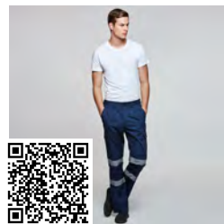
DAILY HV HV9307