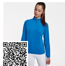
HIMALAYA WOMAN SM1096