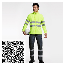
DAILY HV HV9307