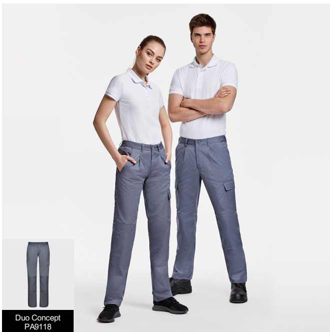
Duo Concept PA9118