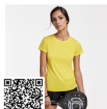
MONTECARLO WOMAN CA0423