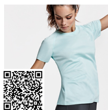
BAHRAIN WOMAN CA0408