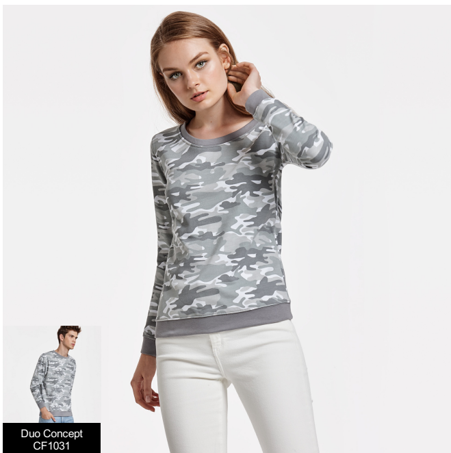
Duo Concept CF1031