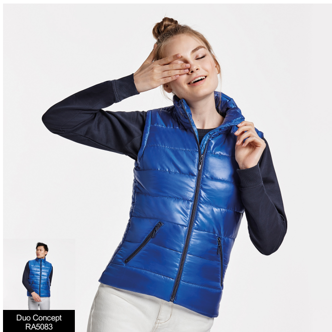
Duo Concept RA5083