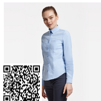
OXFORD WOMAN CM5068