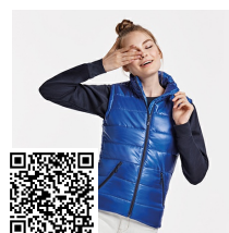
MONTANA WOMAN RA5084