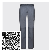
DAILY WOMAN PA9118