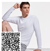
SOUL L/S R12510